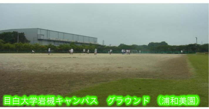
目白大学岩槻キャンパス グラウンド (浦和美園)