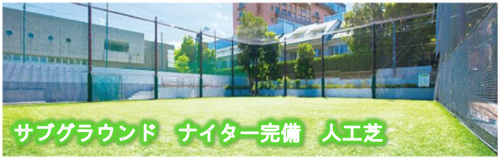
サブグラウンド ナイター完備 人工芝