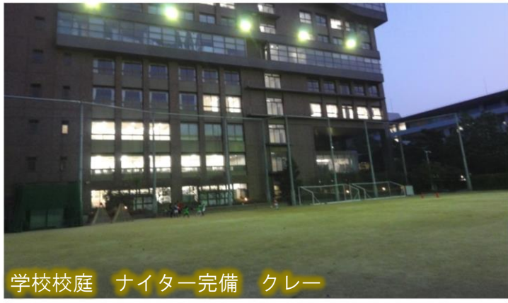
学校校庭 ナイター完備 クレー