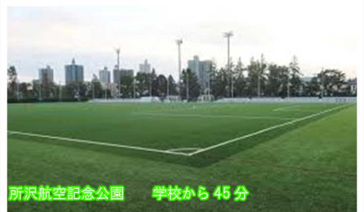
所沢航空記念公園 学校から 45分