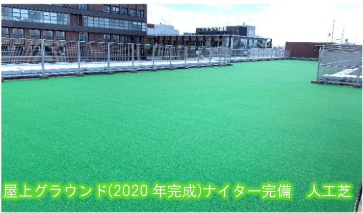
屋上グラウンド(2020年完成)ナイター完備 人工芝