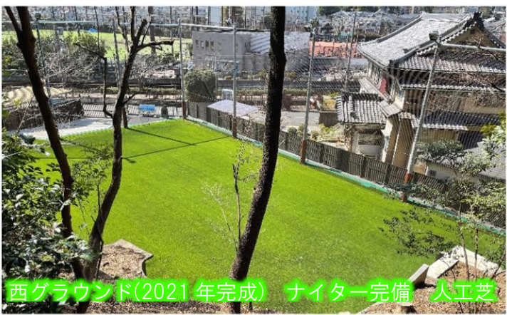
西グラウンド(2021年完成) ナイター完備 人工芝