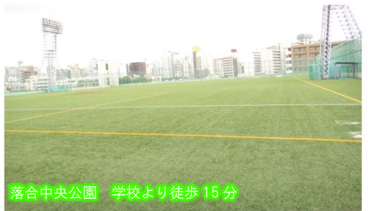
落合中央公園 学校より徒歩 15分